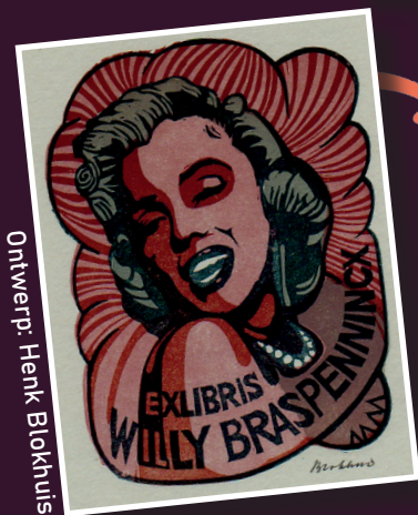
Ontwerp: Henk Blokhuus

Een exlibris of boekmerk is van oudsher een prentje dat vóór in een boek kan worden geplakt en dat aangeeft wie de eigenaar van het boek is. Het gebruik van het exlibris begon al in de middeleeuwen, bij de adel en in kloosters, en vanaf de 19e eeuw namen ook burgers het gebruik over. Tegenwoordig is het exlibris niet meer zozeer als gebruiksvoorwerp in zwang, maar als kunstvorm en verzamelobject is het juist heel actueel.