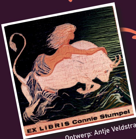
Ontwerp: Antje Veldstra

Voor een fraai en passend exlibris kan men een opdracht geven aan een kunstenaar naar keuze. In overleg met de kunstenaar wordt bepaald welk thema het exlibris moet hebben. Daarbij zijn de mogelijkheden eindeloos: beroep, hobby, afkomst, en vele thema's als familie, dieren, gebouwen, componisten, auteurs, heraldiek, mythologie enz. kunnen in het exlibris tot uiting worden gebracht. Zo kan men in een exlibris tot een persoonlijke storytelling komen. Verzamelen op thema is een geliefde methode.