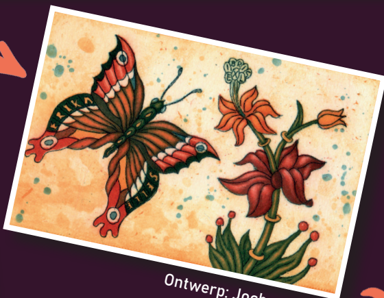
Ontwerp: Jochen Kublik

In Nederland zijn ruim 200 liefhebbers, verzamelaars en kunstenaars verenigd in Exlibriswereld, de Nederlandse vereniging voor exlibris en andere (klein)grafiek, die in 2021 zijn 75-jarig jubileum vierde. Jaarlijks zijn er 3 à 4 bijeenkomsten waar intensief ruilverkeer plaatsvindt, zodat men kan bouwen aan een verzameling. Leden van de vereniging ontvangen jaarlijks 4 nummers van het tijdschrift Grafiekwereld, met interessante, rijk geïllustreerde artikelen. Daarnaast ontvangen de leden jaarlijks een aantal extra's, in de vorm van een prent of een publicatie. En via het antiquariaat van de vereniging kan men tegen bescheiden bedragen de collectie uitbreiden. Kortom, redenen genoeg om een lidmaatschap te overwegen.